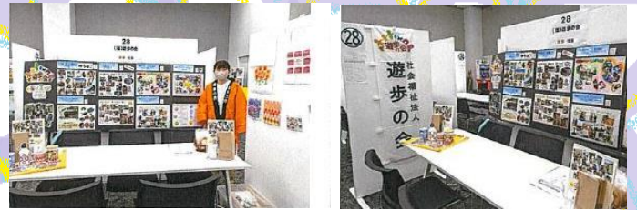
6月11日に出島メッセ長崎で行われた ふくしのお仕事就職フェアに参加しました！！