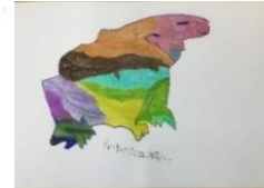
アツヴィ アートプロジェクト PERSPECTIVES 入選 山崎新一さんの 「ホッキョクグマ」