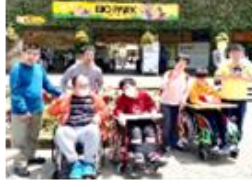
バイオパーク納品