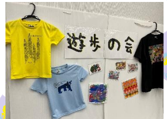
6月20日に出島メッセ長崎で行われた ながさき合同企業面談会に参加しました！！