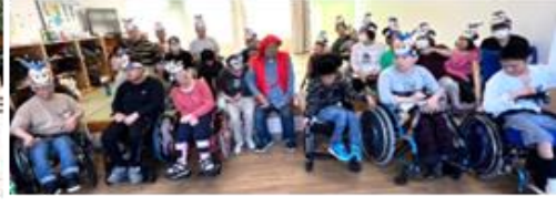
スタッフ還暦祝い